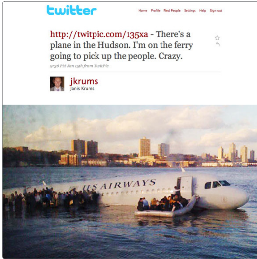
[제니스 크럼스가 트위터로 등록한 허드슨 강 비상착륙 항공기 이미지와 해당 트윗]

일명 ‘허드슨 강의 기적’이라고 불리는 이 사고는 한겨울 날씨에 비행기가 강물에 비상착륙했지만 승객과 승무원 모두 무사했으며 트위터로 해당 사고가 빠르게 전파된 것이 피해를 최소화할 수 있었던 하나의 요인이라고 많은 전문가는 이야기한다. 기자들이 현장에 도착하기 전까지 미디어와 언론은 제니스 크럼스가 트위터로 등록한 사진을 활용했으며 이후 그는 허드슨 강의 스타가 되었다.